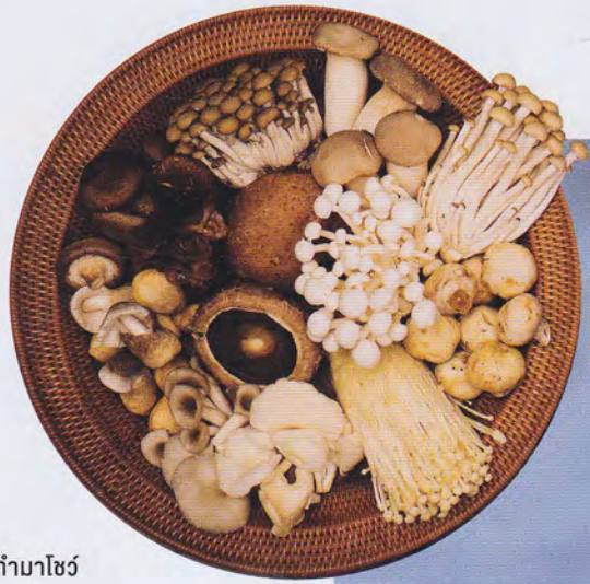
๑๘ → ธรรมชาติ กำมาโซว์ เพลินตากายาเห็ด