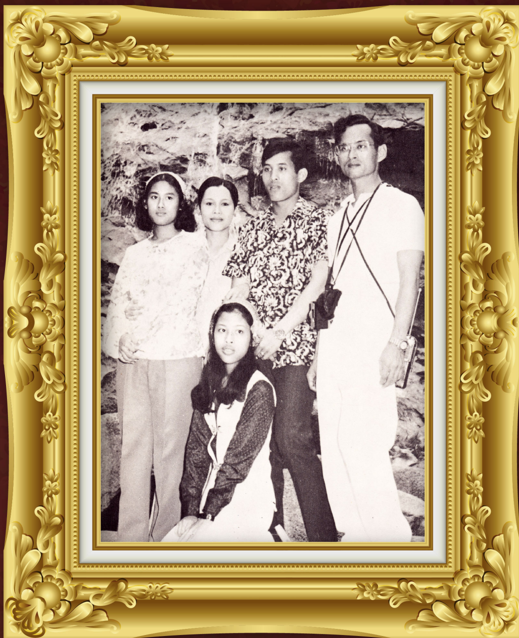
ทรงฉายพระบรมฉายาลักษณ์ร่วมกับ พระบาทสมเด็จพระบรมชนกาธิเบศรมหาภูมิพลอดุลยเดชมหาราช บรมนาถบพิตร รัชกาลที่ ๙ สมเด็จพระนางเจ้าสิริกิติ์พระบรมราชินีนาถ พระบรมราชชนนีพันปีหลวง สมเด็จพระกนิษฐาธิราชเจ้า กรมสมเด็จพระเทพรัตนราชสุดาฯ สยามบรมราชกุมารี และ สมเด็จพระเจ้าน้องนางเธอ เจ้าฟ้าจุฬาภรณวลัยลักษณ์ อัครราชกุมารี ณ น้ำตกบ่าโจ อำเภอบาเจาะ จังหวัดนราธิวาส