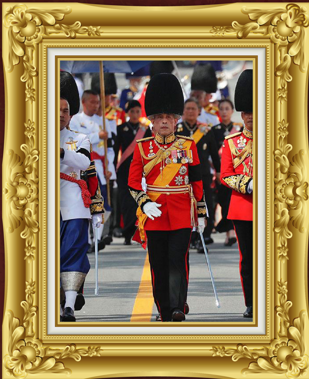
เสด็จพระราชดำเนินร่วมในริ้วขบวนพระบรมราชอิสริยยศ งานพระราชพิธีถวายพระเพลิงพระบรมศพ พระบาทสมเด็จพระบรมชนกาธิเบศรมหาภูมิพลอดุลยเดชมหาราช บรมนาถบพิตร เมื่อวันที่ ๒๖ ตุลาคม พ.ศ. ๒๕๖๐