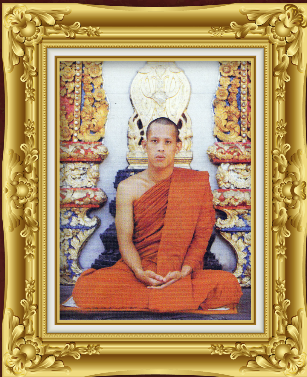
ทรงพระผนวช ณ พระอุโบสถวัดพระศรีรัตนศาสดาราม เมื่อวันที่ ๖ พฤศจิกายน พ.ศ. ๒๕๒๑ ทรงได้รับพระนามฉายาว่า วชิราลงกรโณ กิกขุ เสด็จพระราชดำเนินไปประทับ ณ พระตำหนักปั้นหย่า วัดบวรนิเวศวิหาร