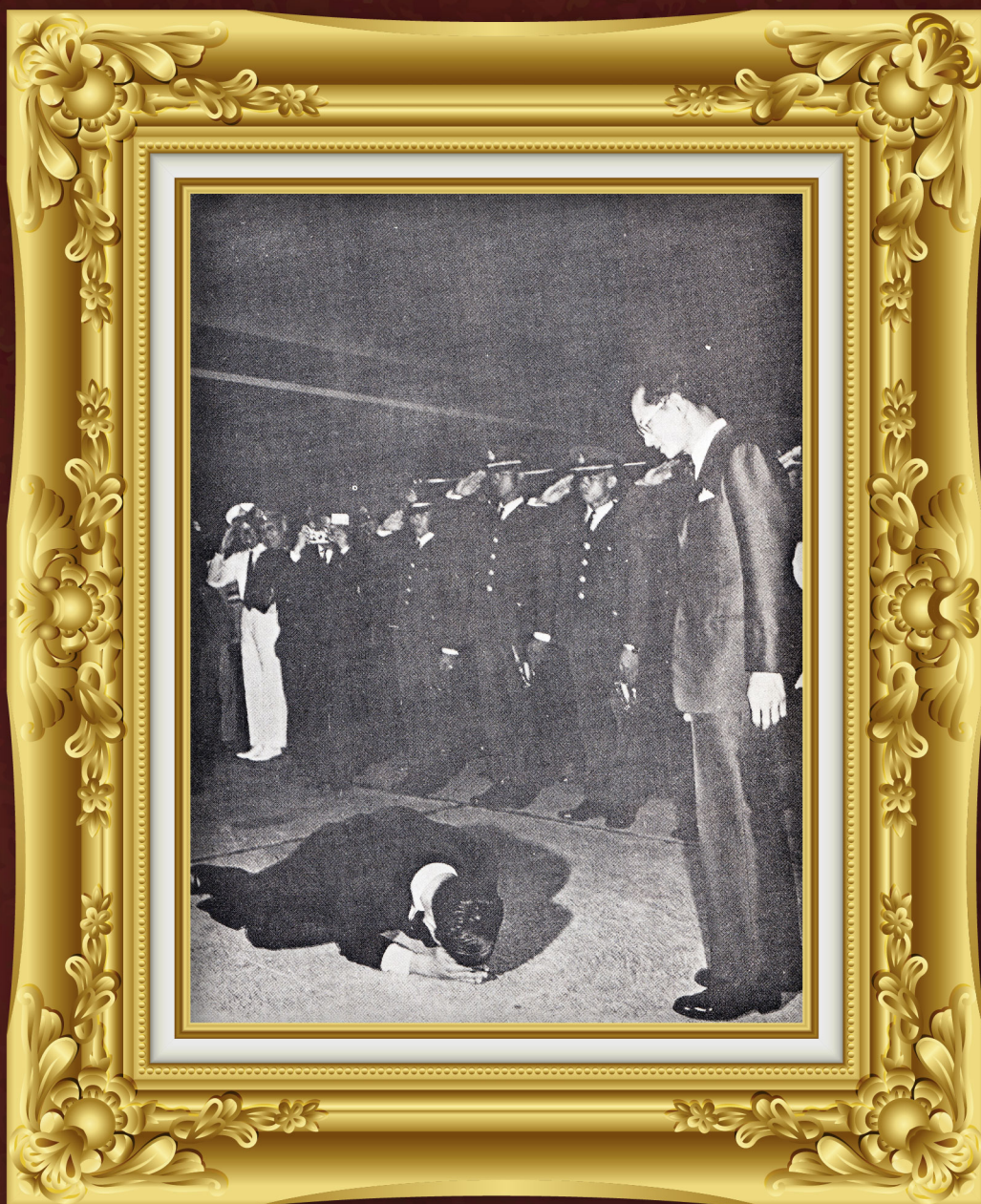
ถวายบังคม พระบาทสมเด็จพระบรมชนกาธิเบศรมหาภูมิพลอดุลยเดชมหาราช บรมนาถบพิตร เมื่อครั้งเสด็จพระราชดำเนินกลับจากประเทศออสเตรเลีย มาประทับในประเทศไทย ระหว่างปิดภาคการศึกษา ณ สนามบินกองบัญชาการกองทัพบก ดอนเมือง เมื่อวันที่ ๒๑ พฤศจิกายน พ.ศ. ๒๕๑๔