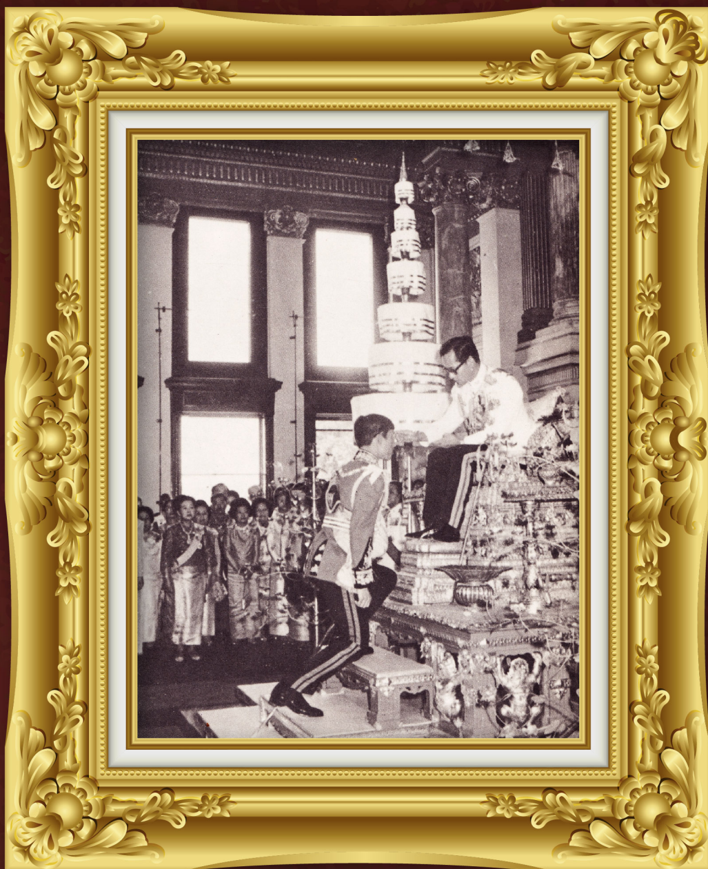
พระบาทสมเด็จพระบรมชนกาธิเบศรมหาภูมิพลอดุลยเดชมหาราช บรมนาถบพิตร รัชกาลที่ ๙ ทรงเจิมพระนลาฏ ในพระราชพิธีสถาปนาเฉลิมพระนามาภิไธย สมเด็จพระบรมโอรสาธิราช สยามมกุฎราชกุมาร เมื่อวันที่ ๒๘ ธันวาคม พ.ศ. ๒๕๑๕