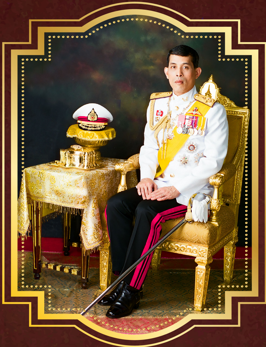
พระบรมฉายาลักษณ์ แห่งความทรงจำ พระบาทสมเด็จพระปรเมนทรรามาธิบดีศรีสินทรมหาวชิราลงกรณ พระวชิรเกล้าเจ้าอยู่หัว