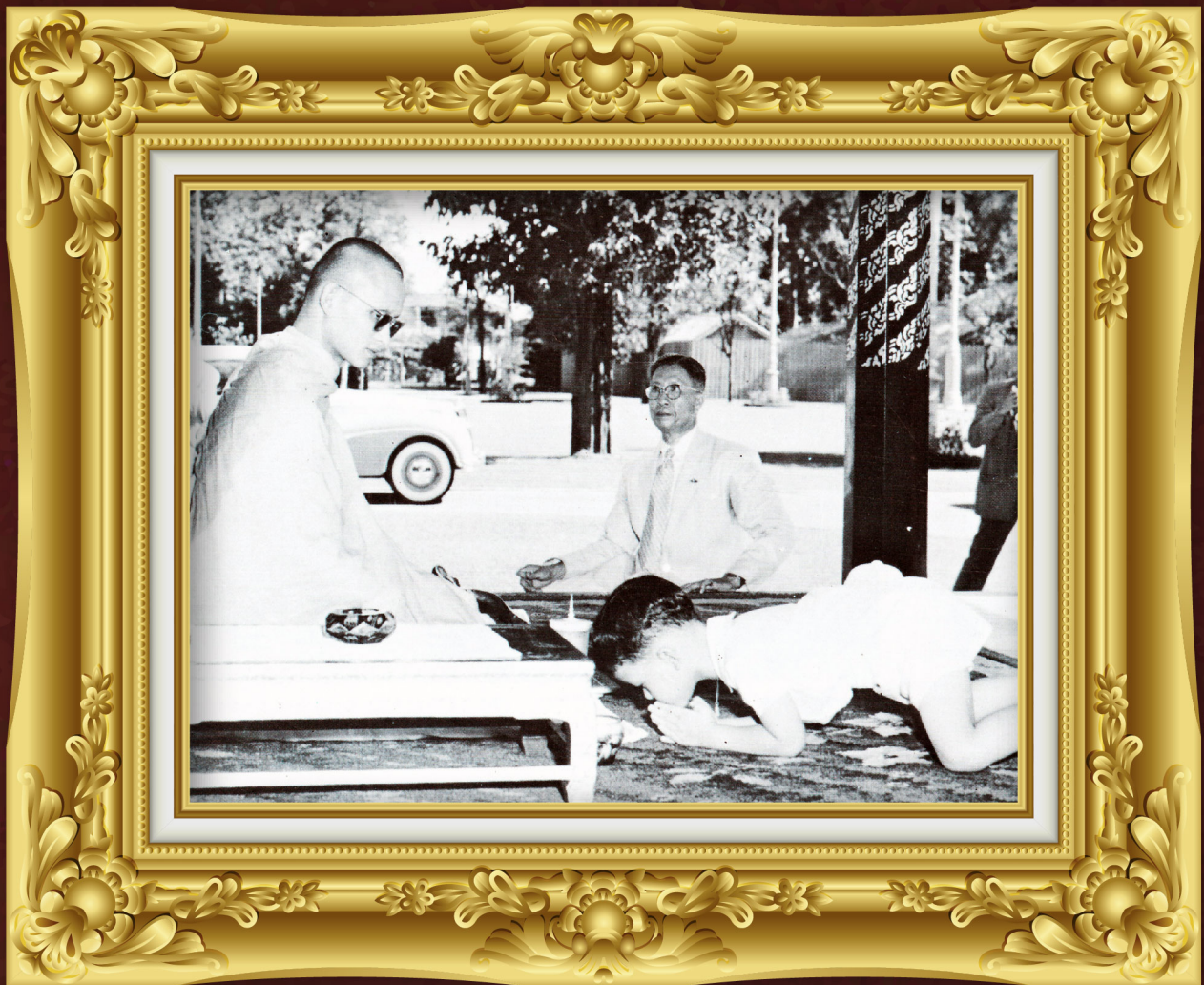
เข้าเฝ้าทูลละอองธุลีพระบาท พระภิกษุพระบาทสมเด็จพระเจ้าอยู่หัว รัชกาลที่ ๙ ณ ศาลารสภาคิริมย์ พระที่นั่งอัมพรสถาน พระราชวังดุสิต เมื่อเดือนตุลาคม พ.ศ. ๒๔๙๙