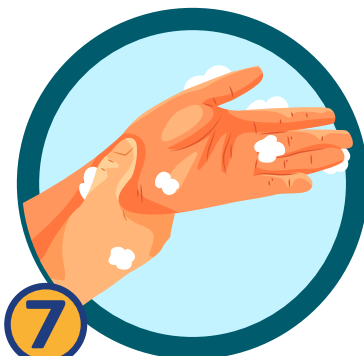
7 ถูรอบ ๆ ข้อมือ