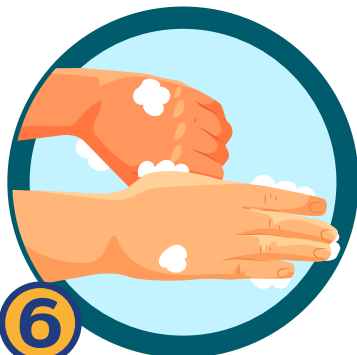
6 ถูโคนนิ้วและนิ้วหัวแม่มือ