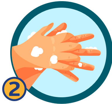
2 ถูง่ามนิ้วมือด้านหน้า