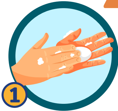
1 ถูฝ่ามือด้วยสบู่