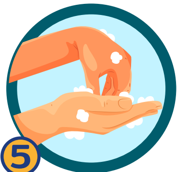
5 ถูปลายนิ้วและเล็บที่ฝ่ามือ