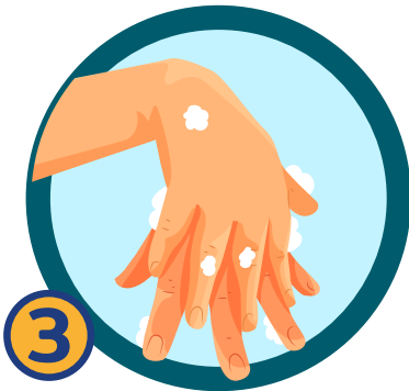
3 ถูง่ามนิ้วมือด้านหลัง และหลังฝ่ามือ