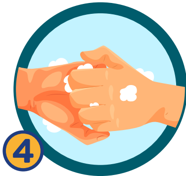
4 ถูนิ้วมือและข้อนิ้วมือ