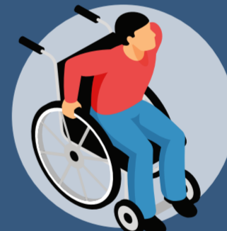
ความพิการ