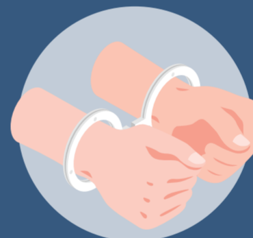
ประวัติอาชญากรรม