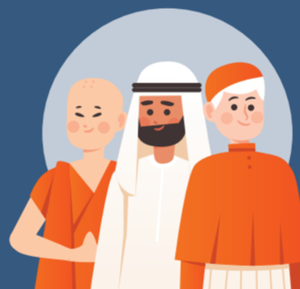
ศาสนา ความเชื่อ