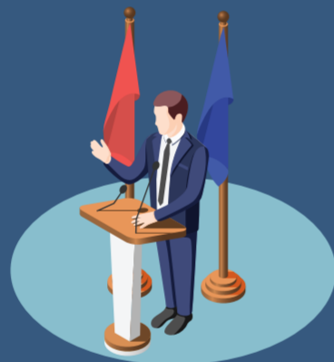
ความคิดเห็นทางการเมือง