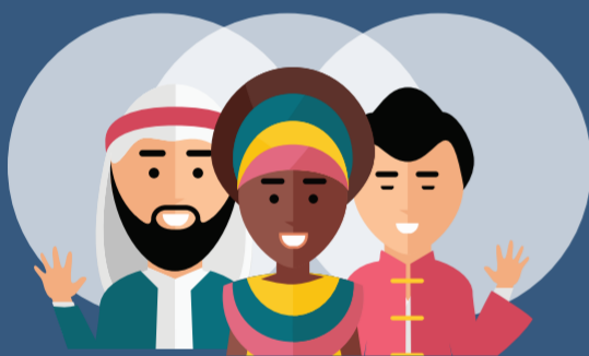
เชื้อชาติ เผ่าพันธุ์

ข้อมูลที่ระบุตัวบุคคลได้เฉพาะเจาะจงมากขึ้น เช่น เชื้อชาติ ความคิดเห็นทางการเมือง ความเชื่อในลัทธิ ศาสนาหรือปรัชญา พฤติกรรมทางเพศ ประวัติอาชญากรรม ข้อมูลสุขภาพ ความพิการ ข้อมูลสหภาพแรงงาน ข้อมูลพันธุกรรม ข้อมูลชีวภาพ (Biometric) ข้อมูลสุขภาพ หรือข้อมูลอื่นใดในทำนองเดียวกันกับที่กฎหมายกำหนด