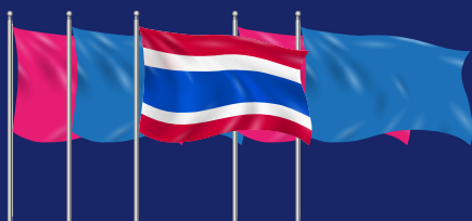
๓.๑ เมื่อรวมกับธงชาติแล้ว นับได้เป็นจำนวนคู่ ให้ธงชาติอยู่กลาง