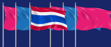
๓.๒ เมื่อรวมกับธงชาติแล้ว นับได้เป็นจำนวนคู่ ให้ธงชาติอยู่กลางด้านขวา