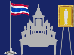
๓.๓ การประดับธงชาติร่วมกับพระพุทธรูป และพระบรมรูปในพิธีการต่าง ๆ ให้จัดธงชาติอยู่ด้านขวาของพระพุทธรูป และพระบรมรูปอยู่ด้านซ้ายของพระพุทธรูป