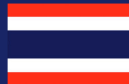
พ.ศ. ๒๔๖๐-ปัจจุบัน