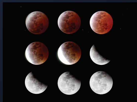
ลำดับการเกิดจันทรุปราคาตั้งแต่อยู่ในเงามัวจนถึงเงามืด

ขณะที่ดวงจันทร์โคจรผ่านเข้าไปในเงามืดของโลก คนบนโลกจะมองเห็นดวงจันทร์เวิ้งเ้างไปทีละน้อยจนดวงจันทร์เข้าไปอยู่ในเงามืดทั้งดวง และเริ่มมองเห็นดวงจันทร์เวิ้งเ้างอีกครั้ง เมื่อดวงจันทร์เคลื่อนที่ออกจากเงามืดของโลก ช่วงที่ดวงจันทร์โคจรเข้าไปอยู่ในเงามืดของโลกบางส่วนจะเรียกว่า “จันทรุปราคาบางส่วน” และช่วงที่ดวงจันทร์โคจรเข้าไปอยู่ในเงามืดของโลกทั้งดวง เรียกว่า “จันทรุปราคาเต็มดวง” จะมองเห็นดวงจันทร์เต็มดวงเป็นสีแดงอิฐ เนื่องจากมีการหักเหของแสงอาทิตย์เมื่อส่องผ่านชั้นบรรยากาศของโลก