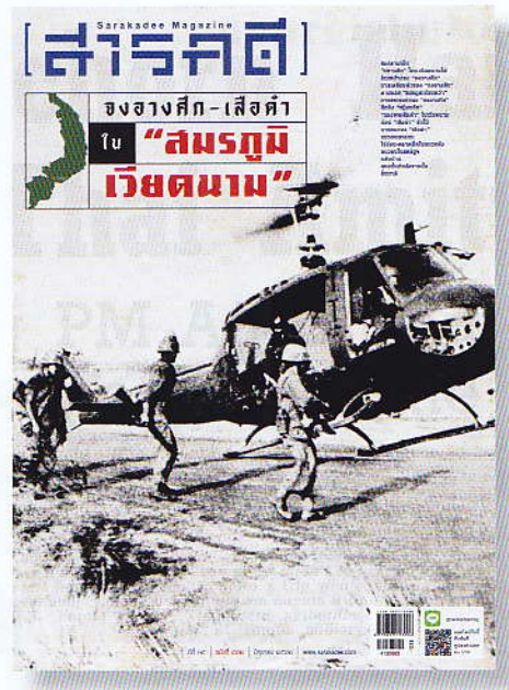
ภาพปก : พิพิธภัณฑ์ทหารผ่านศึกเวียดนาม/ Vietnam Veterans Museum)