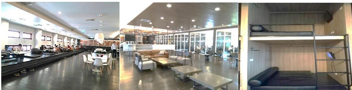
ภาพที่ 15-17 พื้นที่การทำงานร่วมกันภายในห้องสมุดคณะวิศวกรรมศาสตร์จุฬาลงกรณ์มหาวิทยาลัยพื้นที่โล่ง เป็นที่ทำกิจกรรมกลุ่ม กิจกรรมเดี่ยว ห้องกระจกใช้ทำกิจกรรมกลุ่มย่อย เดอะบ็อกซ์เป็นที่พักผ่อนหย่อนใจ

ส่วนหอสมุดป่วย อิงภากรณ์ มหาวิทยาลัยธรรมศาสตร์ (รังสิต) บริเวณชั้น 1 ของอาคาร มีพื้นที่ใช้สอยเพื่อการแลกเปลี่ยนเรียนรู้ 1,500 ตารางเมตร สำหรับนักศึกษา ที่เรียกว่า TCS : Thammasat Creative Space มีครุภัณฑ์ประกอบอาคารและอุปกรณ์เทคโนโลยีอำนวยความสะดวกพื้นฐานแก่ผู้ใช้ห้องสมุด โดยจัดแบ่งพื้นที่เป็น 3 โซนหลัก คือ โซนพื้นที่ทำงานขนาดใหญ่ เพื่อให้เกิดบรรยากาศการสร้างสรรค์และพบปะแลกเปลี่ยนองค์ความรู้