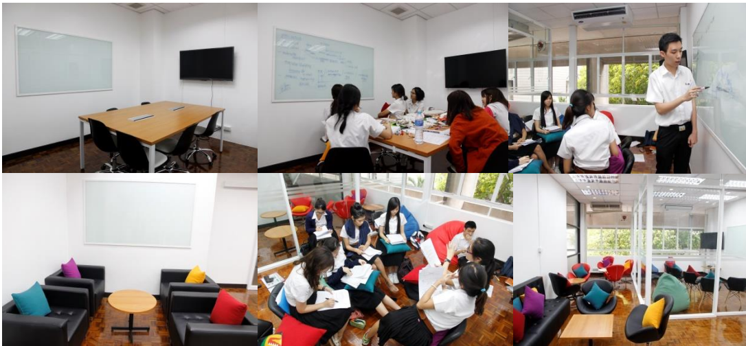
ภาพที่ 6-11 พื้นที่การทำงานร่วมกันภายในห้องสมุดสตางค์ มงคลสุข คณะวิทยาศาสตร์ มหาวิทยาลัยมหิดล มีห้องประชุมกลุ่มที่เป็นทางการ ห้องเก้าอี้โซฟา บรรยากาศสบายๆ ปลั๊กไฟ กระดาน

ห้องสมุดเฉพาะอีกแห่งหนึ่งคือ ห้องสมุดสตางค์ มงคลสุข คณะวิทยาศาสตร์ มหาวิทยาลัยมหิดล ก็มีการจัดพื้นที่การทำงานร่วมกัน โดยมีทั้งห้องสัมมนาและห้องประชุมกลุ่มย่อย พร้อมอุปกรณ์เทคโนโลยีที่ทันสมัย มีการกำหนดระเบียบการใช้พื้นที่คล้ายคลึงกับระเบียบการใช้พื้นที่ของห้องสมุดริชแลนด์ในสหรัฐอเมริกา บุคคลภายนอกใช้พื้นที่นี้ได้ แต่จะมีค่าธรรมเนียมการใช้ห้องเล็กน้อย