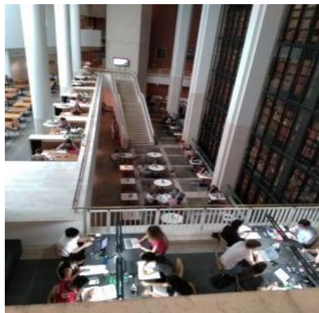
ภาพที่ 1 พื้นที่การทำงานร่วมกันมุมหนึ่งในหอสมุดแห่งชาติอังกฤษ ที่บุคคลทั่วไปสามารถเข้ามาใช้บริการและเข้าถึงสารสนเทศที่มากมายมหาศาลผ่านอินเทอร์เน็ตไร้สายคุณภาพเยี่ยม

ห้องสมุดอีกแห่งหนึ่งในลอนดอนที่มีพื้นที่การทำงานร่วมกันที่ดีที่สุดสำหรับผู้ประกอบการคือ หอสมุดแห่งชาติอังกฤษ (The British Library) ภายในอาคารมีปีกหนึ่งที่ตั้งเป็นพื้นที่พิเศษเฉพาะสำหรับเจ้าของธุรกิจขนาดเล็กและนักลงทุน ผู้ใช้สามารถเข้าถึงสารสนเทศได้อย่างมหาศาล เช่น ข้อมูลรายงานตลาดออนไลน์ของบริษัทวิจัยด้านการตลาดและพฤติกรรมผู้บริโภคที่มีชื่อเสียงระดับโลก เช่น Mintel, Frost & Sullivan, Euromonitor ที่มีมูลค่ามากกว่า 5 ล้านปอนด์ ข้อมูลบริษัทในสหราชอาณาจักรและทั่วโลกมากกว่า 144 ล้านราย มีห้องเรียนสำหรับการเรียนในหลักสูตรต่างๆ การฝึกอบรม การฝึกปฏิบัติด้านนวัตกรรม อินเทอร์เน็ตไร้สายที่หอสมุดแห่งชาติอังกฤษมีค่าใช้จ่าย แต่ก็รับประกันได้ว่าสัญญาณดีเยี่ยม และมีร้านกาแฟ อาหารจานเดียวด้วย(Rocketspace, 2017)