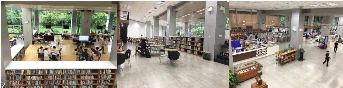
ภาพที่ 12-14 พื้นที่การทำงานร่วมกันภายในสำนักงานวิทยทรัพยากร จุฬาลงกรณ์มหาวิทยาลัยบรรยากาศสบายๆ สามารถสืบค้นสารสนเทศออนไลน์ มีร้านกาแฟ

นอกจากนี้ยังมีห้องสมุดตามคณะต่างๆ ในมหาวิทยาลัยที่มีพื้นที่การทำงานร่วมกันที่น่าสนใจอีกหลายแห่ง เช่น ห้องสมุดคณะวิศวกรรมศาสตร์ มีพื้นที่การทำงานร่วมกันที่ตกแต่งภายในสนองตอบการใช้งานของนักศึกษาวัยรุ่น ส่วนที่เป็นพื้นที่โล่งนักศึกษาใช้เป็นทำกิจกรรมกลุ่ม กิจกรรมเดี่ยว ใช้เสียงได้ ส่วนที่เป็นห้องกระจก ใช้ทำกิจกรรมกลุ่มย่อย มีเทคโนโลยีสารสนเทศทันสมัยในห้อง คอมพิวเตอร์ กระจกานอิเล็กทรอนิกส์ มีห้องที่เรียกว่า “เดอะบ็อกซ์” ที่นักศึกษาสามารถใช้พื้นที่นี้เพื่อการพักผ่อนหย่อนใจ พร้อมกับการชมสื่อมัลติมีเดีย การจัดพื้นที่ เดอะบ็อกซ์ของห้องสมุดคณะวิศวกรรมศาสตร์ในคราวเปิดตัวครั้งแรกนั้น ผู้ใช้ห้องสมุดในประเทศไทยให้ความสนใจกับความแปลกใหม่เป็นอย่างยิ่ง ทีมศึกษาวิจัยก่อนการปรับเปลี่ยนกายภาพห้องสมุดระบุว่า การปรับเปลี่ยนพื้นที่เป็นเพียงส่วนหนึ่งเท่านั้น แต่หัวใจสำคัญคือตอบสนองความต้องการที่หลากหลายของผู้ใช้งาน เพราะนิสิตส่วนใหญ่ต้องการให้ห้องสมุดเป็นพื้นที่อ่านหนังสือส่วนตัวและพักผ่อน ตลอดจนใช้ตัวหนังสือกับเพื่อน มากกว่าการเข้าห้องสมุดเพื่อยืมคืนหนังสือเท่านั้น