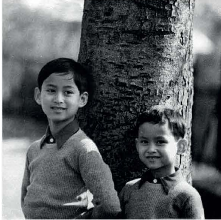
พระวรวงศ์เธอ พระองค์เจ้าอานันทมหิดล และ พระวรวงศ์เธอ พระองค์เจ้าภูมิพลอดุลยเดช