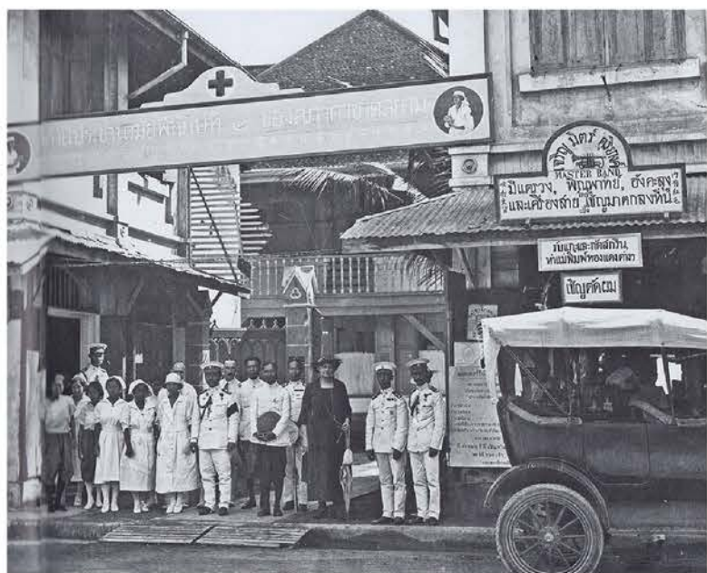
สมเด็จพระเจ้าพี่นางเธอ เจ้าฟ้ากัลยาณิวัฒนา กรมขุนน่านราชบุรี เสด็จไปเปิดสถานีประชาอนามัยพิทักษ์ที่ ๒ ชั่วคราว ของสภาเทศบาลสยาม (ต่อมาเรียกว่า สถานีอนามัยที่ ๒)