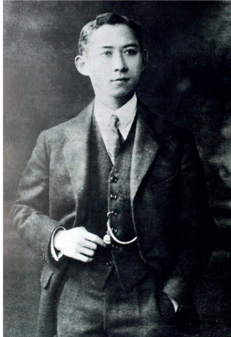
สมเด็จพระเจ้าฟ้ามหิดลอดุลยเดช กรมขุนสงขลานครินทร์