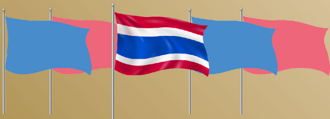
การประดับธงชาติร่วมกับธงอื่น กรณีธงรวมนับเป็นจำนวนคี่